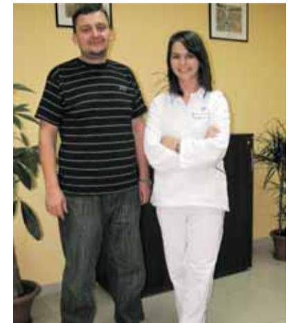
Teraz: 107 kg, 101 cm w pasie

Po skończeniu kuracji zamierzam pójść na siłownię. Ćwiczę też na rowerku w domu i bardzo dużo chodzę. Czasem z pracy wracam na nogach.